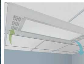
Panneaux réguliers carrés Calla Health Zone Santé AirAssure avec système de suspension Suprafine SM XL MC à tête exposé de 9/16 po

Dessins CAD/Revit MD à : armstrongplafonds.ca/cadrevit